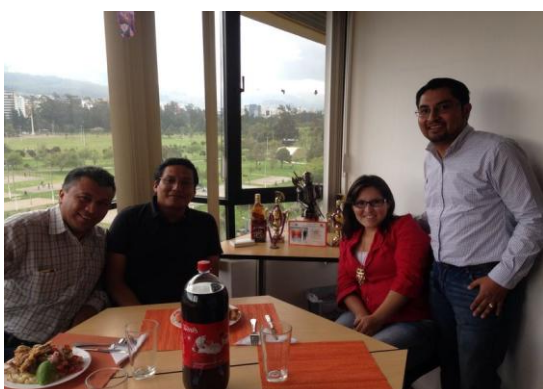
Fiestas de Quito Diciembre 2013