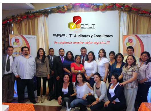
Seminario Actualización NIIF y Cierre Fiscal - Loja - Diciembre 2013