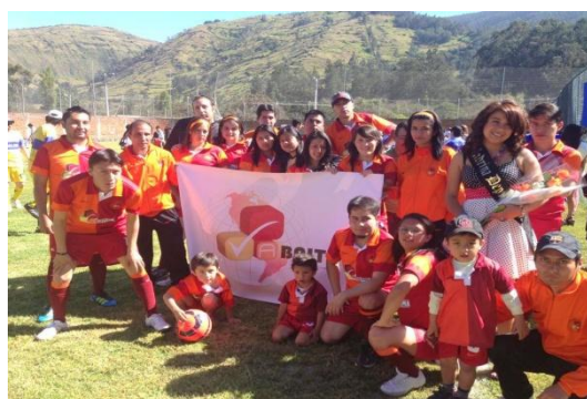
Campeonato de futbol - Colegio de Contadores de Pichincha - Junio 2013