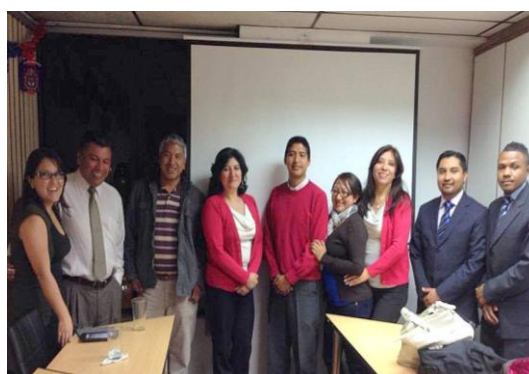
Seminario Cierre Fiscal - Quito Diciembre 2013