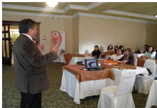
Seminario actualización laboral - Quito Enero 2013.