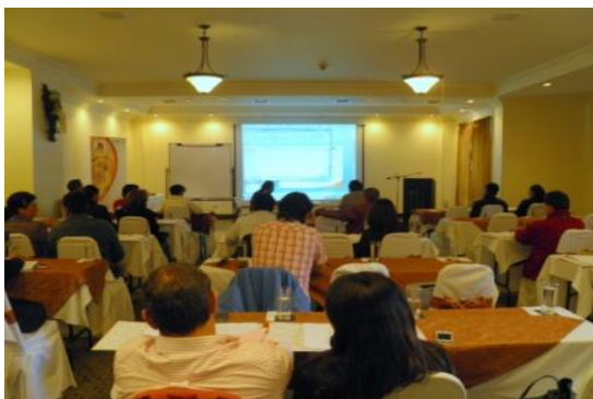
Seminario reformas tributarias - Quito Enero 2013.