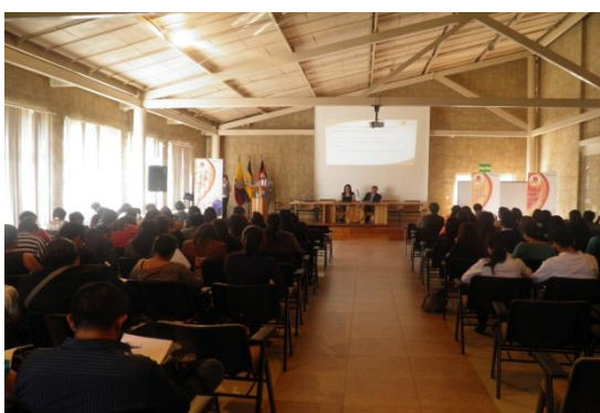
Seminario NIIF - Universidad Politécnica Salesiana - Noviembre 2013