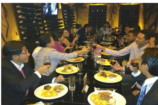
Aniversario ABALT - Quito Febrero 2013.